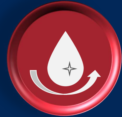
Stacje uzdatniania wody